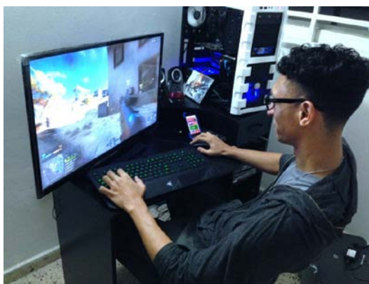
ภาพที่ 9.4 การใช้งานคอมพิวเตอร์สำหรับเล่นเกมคอมพิวเตอร์

เครื่องคอมพิวเตอร์ที่ใช้สำหรับเล่นเกมคอมพิวเตอร์ถูกมองว่าเป็นสินค้าฟุ่มเฟือยเนื่องจากต้องใช้งบประมาณจำนวนมากในการจัดซื้อ เพราะปัจจุบันผู้สร้างเกมคอมพิวเตอร์ค่ายต่าง ๆ มักจะแข่งขันกันพัฒนาขีดความสามารถในการแสดงผลอยู่ตลอดเวลา ซึ่งเกมเหล่านี้ต้องการใช้ทรัพยากรของเครื่องที่สูง ๆ ทั้งสิ้น โดยเฉพาะอย่างยิ่งการ์ดจอ ดังนั้นนักเล่นเกมจึงต้องลงทุนในการซื้อเครื่องคอมพิวเตอร์ที่มีประสิทธิภาพสูงไว้ก่อนเพื่อรองรับกับเกมใหม่ ๆ ที่ทยอยออกมาจำหน่าย