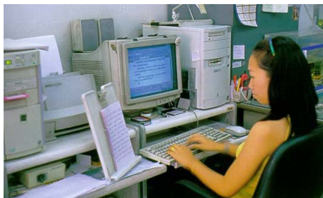
ภาพที่ 9.1 การใช้งานคอมพิวเตอร์ทำงานด้านเอกสาร รายงาน หรืองานธุรการต่าง ๆ

งานด้านนี้มักจะใช้โปรแกรมในด้านการจัดการเอกสารเป็นหลัก เช่น Microsoft Office หรือโปรแกรมกลุ่ม Open Office และโปรแกรมสำเร็จรูปต่าง ๆ ที่ถูกออกแบบมาให้ใช้งานเฉพาะ ด้านตามแต่ละหน่วยงานหรือบริษัทนั้น ๆ เลือกใช้ ซึ่งโปรแกรมเหล่านี้ไม่จำเป็นต้องใช้เครื่อง คอมพิวเตอร์ที่มีประสิทธิภาพสูงนัก สามารถเลือกซื้อเครื่องคอมพิวเตอร์ที่มีราคาถูกในท้องตลาด ทั่วไปได้