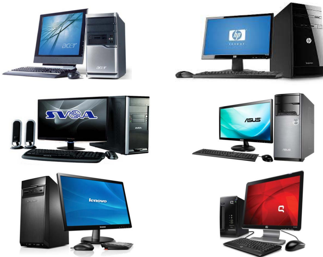
ภาพที่ 9.5 เครื่องคอมพิวเตอร์แบบมีี่ห้อ (Brand)

คอมพิวเตอร์ประเภทนี้นิยมเรียกว่าคอมพิวเตอร์แบรนด์เนม (Brand Name) เป็นคอมพิวเตอร์ที่ประกอบเสร็จมาจากโรงงานพร้อมใช้งานได้เลย เหมาะกับผู้ใช้ที่ต้องการความสะดวกไม่ต้องวุ่นวายในการเลือกซื้อชิ้นส่วนอุปกรณ์ต่าง ๆ ส่วนใหญ่มักจะมีบริการหลังการขายที่ดี แต่ราคาค่อนข้างสูงและไม่สามารถปรับเปลี่ยนหรือเลือกอุปกรณ์ได้ตามใจชอบ เหมาะกับผู้ใช้ไม่ค่อยมีความรู้ความชำนาญในเรื่องชิ้นส่วนต่าง ๆ ของคอมพิวเตอร์ ซึ่งคอมพิวเตอร์ลักษณะนี้ อุปกรณ์หลักเช่นเมนบอร์ดมักจะไม่เอื้ออำนวยต่อการอัปเดตเครื่องคอมพิวเตอร์ในอนาคตได้มากนัก สำหรับยี่ห้อต่าง ๆ ของเครื่องคอมพิวเตอร์ลักษณะนี้ที่มีขายในท้องตลาดได้แก่ยี่ห้อ Acer, HP, Compaq, Lenovo, SVOA, Asus เป็นต้น