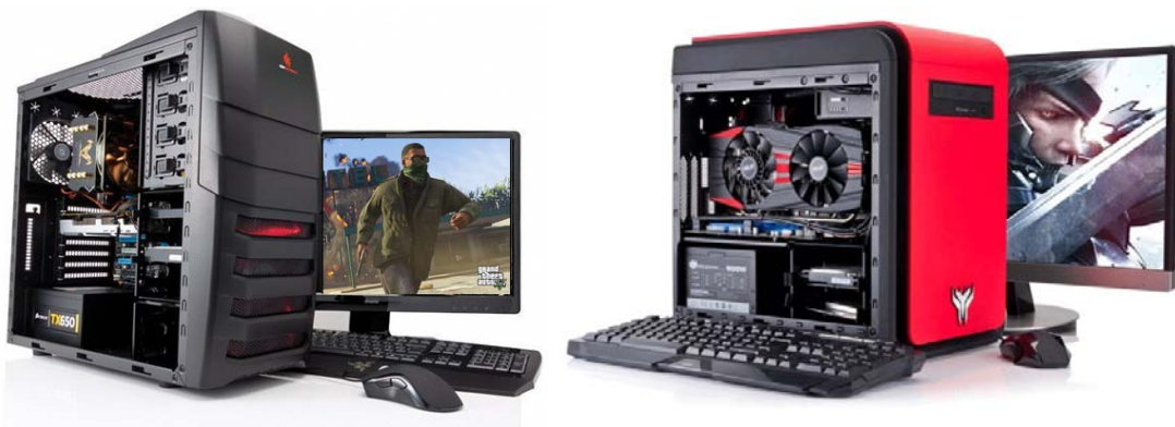
ภาพที่ 9.6 เครื่องคอมพิวเตอร์แบบประกอบเอง

เครื่องคอมพิวเตอร์ลักษณะนี้เหมาะกับผู้ใช้งานที่ต้องการความพิถีพิถันในการเลือกซื้อชิ้นส่วนอุปกรณ์คอมพิวเตอร์ต่าง ๆ เอง เพื่อจ้างประกอบ หรือประกอบด้วยตนเอง เพื่อให้ได้เครื่องคอมพิวเตอร์ที่มีราคาไม่แพงและมีคุณสมบัติตรงตามความพอใจของผู้ใช้มากที่สุด การเลือกซื้อเครื่องคอมพิวเตอร์ลักษณะนี้ ผู้ใช้ต้องมีความรู้ความชำนาญเกี่ยวกับชิ้นส่วนอุปกรณ์คอมพิวเตอร์ต่าง ๆ อยู่บ้างพอสมควร แต่ในปัจจุบันร้านจำหน่ายอุปกรณ์คอมพิวเตอร์จะมีบริการจัดชุดคอมพิวเตอร์ให้ครบชุดเพียงแต่ลูกค้าบอกความต้องการในการนำไปใช้งานและงบประมาณที่ตั้งไว้