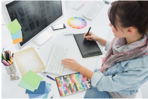
ภาพที่ 9.2 การใช้งานคอมพิวเตอร์ทำงานด้านกราฟิก ด้านการออกแบบสื่อสิ่งพิมพ์ต่าง ๆ